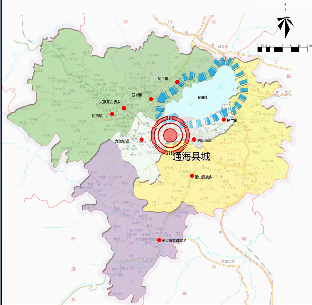
生产力空间布局图